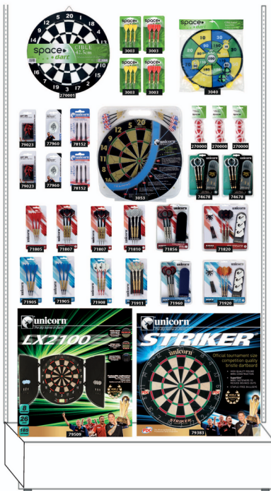
Exemple élément ciblerie

Retrouvez dans votre rayon sports et loisirs les indispensables fléchettes ainsi que les cibles, mais également des nouveautés et tous les accessoires pour devenir un as des fléchettes.