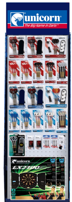
Exemple display Ciblerie UNICORN